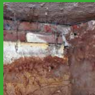
J2 Zwam op muur