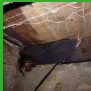
J1 Balk aangetast